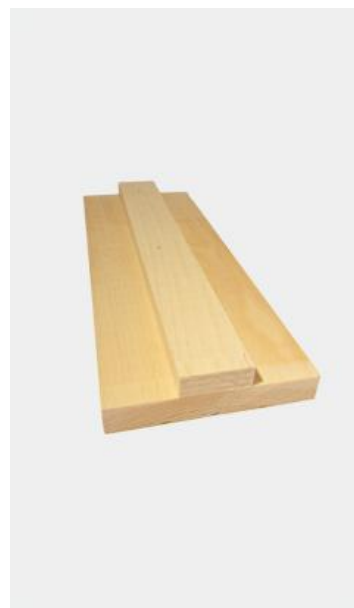
MODÈLE EN T B2100