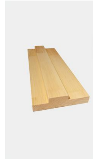
ENFIGURÉS DOUBLE B2400